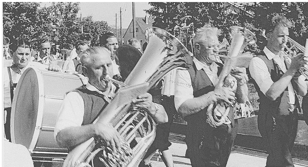
Die Blaskapelle gibt den Ton an.