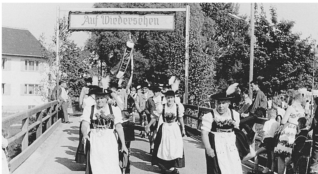
Der Einzug über die alte Kanalbrücke.