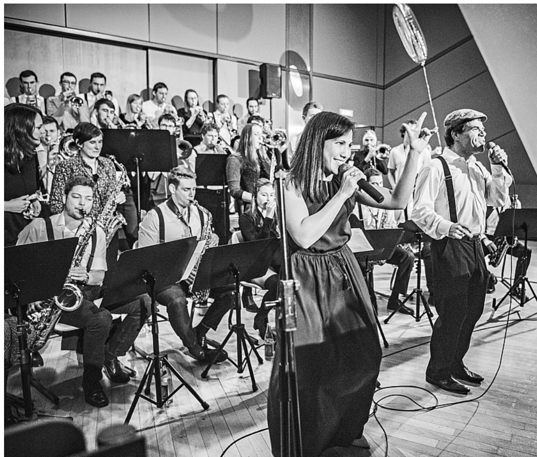
Die Big Band der Hochschule München kommt am 5. Juni in's KOM.

Bis zu 25 Musiker (Trompeten, Posaunen, Saxofone und Rhythmusgruppe) spielen un-