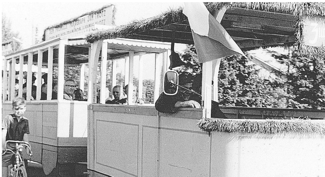
Die Trambahn auf dem Weg zum Festplatz.