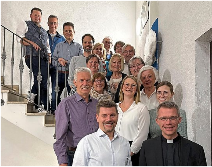
Neuer Vorstand und Familienrat der Kolpingsfamilie Olching.