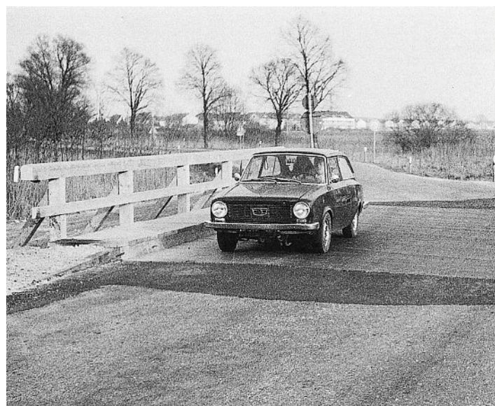
Alte Holzbrücke über den früheren Altwasserarm der Amper und den Starzelbach, 1972.

Von wegen klein und unscheinbar: Die Starzel ist ein beliebtes Naherholungsgebiet für die Bewohner der umliegenden Gemeinden. Sie entspringt im Bernrieder Wald bei Schöngeising in mehreren Quellbächen, fließt durch Alling, Hoflach, Eichenau, und Gut Roggenstein in Richtung Olching und mündet zwischen Olching und dem