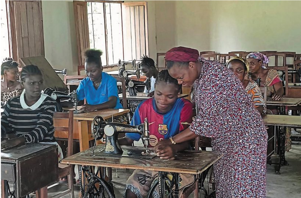
Die Nähschule in Bokungu im Kongo mit den neuen Schülerinnen und Schülern.