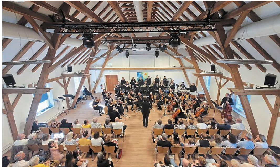
Muttertagskonzert des Olchinger Sinfonieorchesters