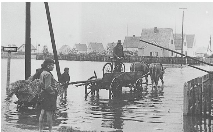
Hochwasser in der Siedlerstraße, die 1940 noch Kreuzstraße hieß.

Von wegen klein und unscheinbar: Die Starzel ist ein beliebtes Naherholungsgebiet für die Bewohner der umliegenden Gemeinden. Sie entspringt im Bernrieder Wald bei Schöngeising in mehreren Quellbächen, fließt durch Alling, Hoflach, Eichenau, und Gut Roggenstein in Richtung Olching und mündet zwischen Olching und dem